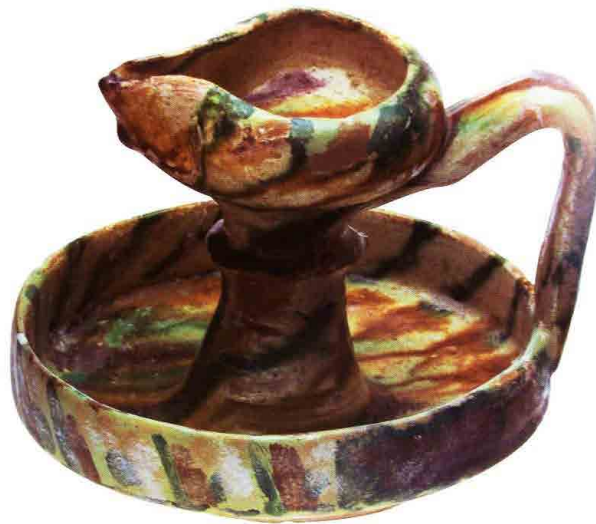
تصویر ۷. چراغ سفالی با لعاب پاشیده، اواخر سده ۳ یا ۴ ه.ق. بلندا: ۱۰ سانتی متر. موزه طارق رجب، کویت (برگرفته از: Fehervari, 2000: No.35.CER 903 TSR).