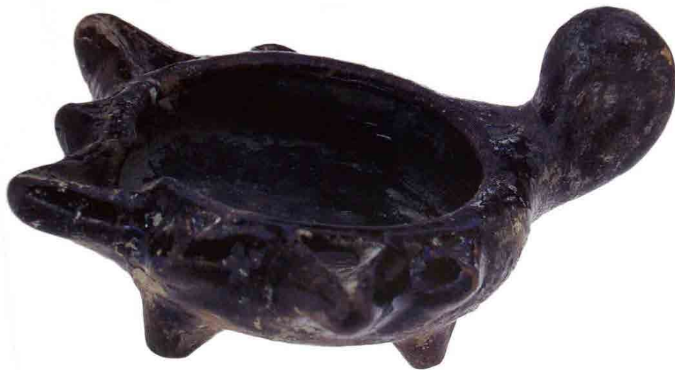
تصویر ۳. پیه سوز سفالی بالعباب تک رنگ، سده ۳-۴ ه.ق. بلندا: ۴/۵ سانتی متر؛ پهنا: ۹ سانتی متر؛ درازا: ۱۱ سانتی متر. کویت، موزه طارق رجب (برگرفته از: (Fehervari, 2000: No.159.CER 342 TSR).

Fig. 2. Oil Lamp, earthenware, monochrome glaze, possibly form 11 th -12 th century, height: 3.5 cm, width: 7 cm, length: 11 cm. Tareq Rajab Museum, Kuwait. After Fehervari, 2000: No.158.CER 339 TSR