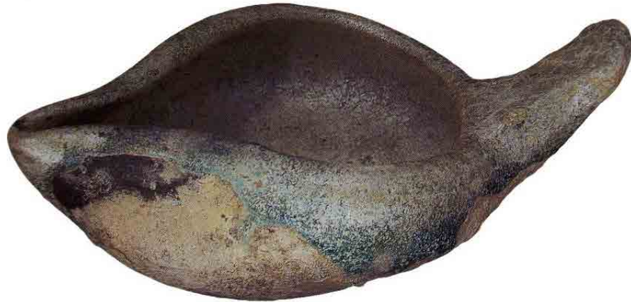
تصویر ۲. پیه سوز سفالی بالعباب تک رنگ، سده ۵ و ۶ ه.ق.، بلندا: ۳/۵ سانتی متر؛ پهنا: ۷ سانتی متر؛ درازا: ۱۱ سانتی متر. کویت، موزه طارق رجب (برگرفته از: (Fehervari, 2000: No.158.CER 339 TSR).

Fig. 2. Oil Lamp, earthenware, monochrome glaze, possibly form 11 th -12 th century, height: 3.5 cm, width: 7 cm, length: 11 cm. Tareq Rajab Museum, Kuwait. After Fehervari, 2000: No.158.CER 339 TSR