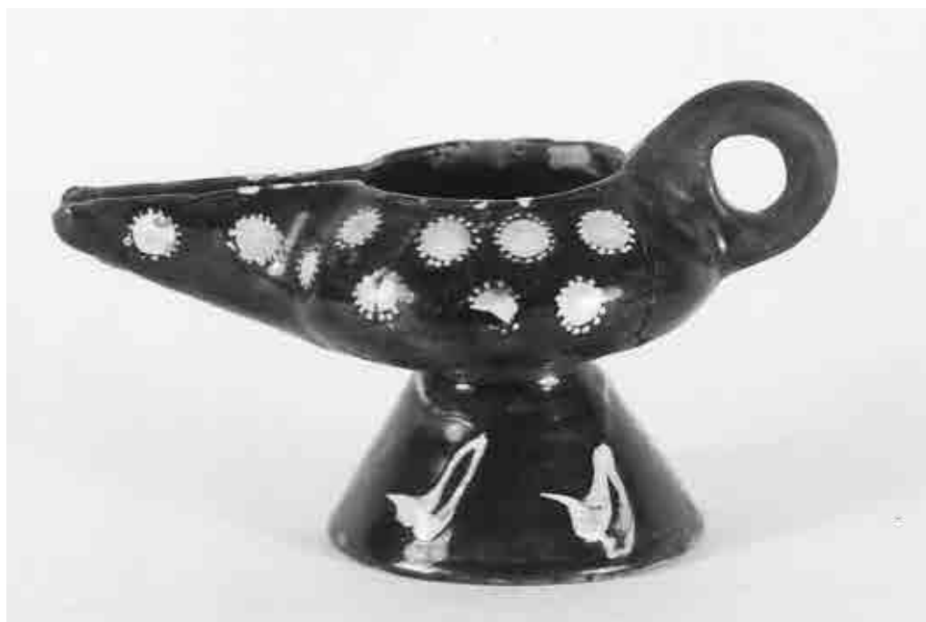
تصویر ۶. چراغ سفالی لعاب‌دار با تزئینات زیرلعابی، سده ۴ ه.ق. (تهران، موزه ملی ایران: ش. ۱۰۲۹). Fig. 6. Oil Lamp, earthenware, underglazed decorations, possibly form 10 th century (Tehran, National Museum of Iran, inv. No. 1029).

از کاوش‌های سیرجان، متعلق به سده‌های ۳ تا ۶ ه.ق. نیز به دست آمده است که البته از کاربری آن‌ها آگاهی دقیقی نداریم (Allan & Roberts, 1987: Fig.13:13-22). با این‌همه، با استناد به یکی از نسخه‌های آبرنگ دیوان امیر شاهی سبزواری که مربوط به دوره‌های جدیدتری است، می‌توان کاربری شمعدان را نیز برای این وسیله‌ها در نظر گرفت (کاخ گلستان؛ گنجینه کتب و نفایس خطی، ۱۳۷۹: ش. ۱۲۰). همچنین، اگر به‌کارگیری بشقاب زیرپایه در این نوع چراغ‌ها را ملهم از نوعی کاربرد خاص پیه‌سوزهای مفرغی بدانیم، چندان بی‌راهه نرفته‌ایم. به‌گواهی متون و شواهد تصویری می‌دانیم که گاهی پیه‌سوزها را جهت افزایش نظافت داخل بشقاب یا طبقچه‌ای مفرغی یا برنجی گذاشته استفاده می‌کرده‌اند (ابن بطوطه، ۱۳۷۶: ۳۴۸؛ Baer, 1983: fig. 1 and 2).