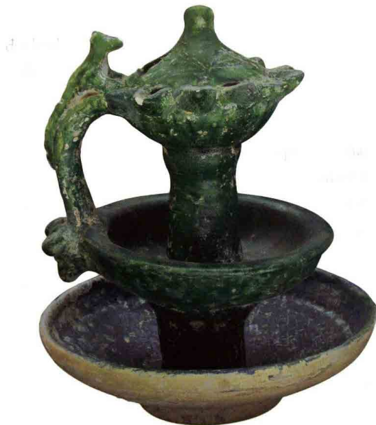
تصویر ۹. چراغ سفالی با لعاب تک‌رنگ، ایران یا آسیای مرکزی، سده پنجم-ششم هجری قمری بلندا: ۲۱ سانتی‌متر؛ قطر چراغ: ۱۱/۵ سانتی‌متر؛ قطر پایه: ۱۸ سانتی‌متر. کویت، موزه طارق رجب (برگرفته از: Fe-hervari, 2000: No.174.CER 981 TSR).

Fig. 8. Oil Lamp, earthenware, glazed, possibly form 12 th century (Tehran, National Museum of Iran, inv. No. 6191).