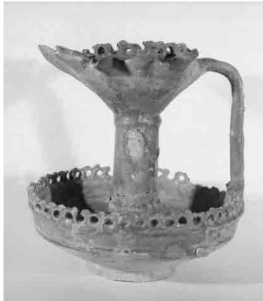
تصویر ۸. چراغ نه‌شعله سفالی لعاب‌دار، ایران، سده ۶ ه.ق. (تهران: موزه ملی ایران، بخش هنر اسلامی، شماره ۶۱۹۱).

Fig. 8. Oil Lamp, earthenware, glazed, possibly form 12 th century (Tehran, National Museum of Iran, inv. No. 6191).